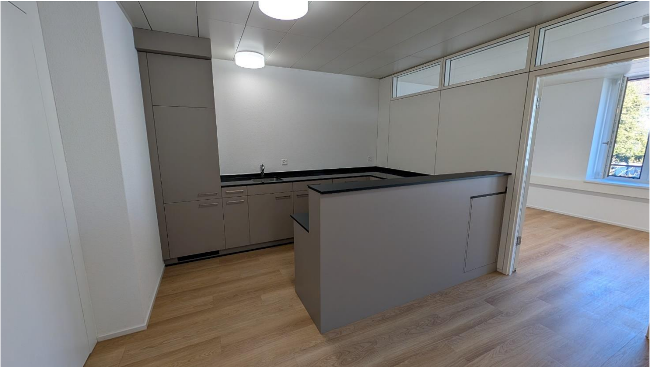
Küche mit Kühlschrank und Spülbecken