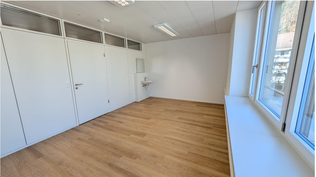
Raum mit Lavabo, Ausrichtung Ost