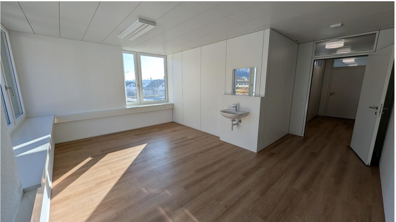
Raum mit Lavabo, Ausrichtung Südost