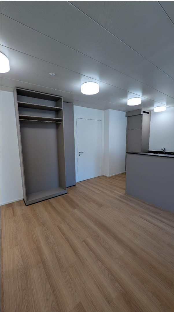
Eingangsbereich mit Garderobe